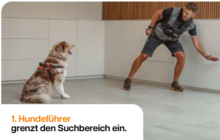
1. Hundeführer grenzt den Suchbereich ein.