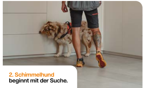
2. Schimmelhund beginnt mit der Suche.