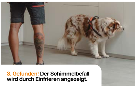
3. Gefunden! Der Schimmelbefall wird durch Einfrieren angezeigt.