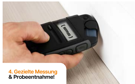
4. Gezielte Messung & Probeentnahme!