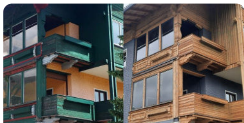
VORHER & NACHHER

Das umweltfreundliche Verfahren kann auch bei begrenztem Raum (in Ecken & Nischen) erfolgreich angewendet werden. Das Trockeneis verflüchtigt sich rückstandslos während der Reinigung.