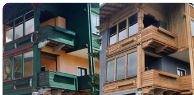
VORHER & NACHHER

Das umweltfreundliche Verfahren kann auch bei begrenztem Raum (in Ecken & Nischen) erfolgreich angewendet werden. Das Trockeneis verflüchtigt sich rückstandslos während der Reinigung.